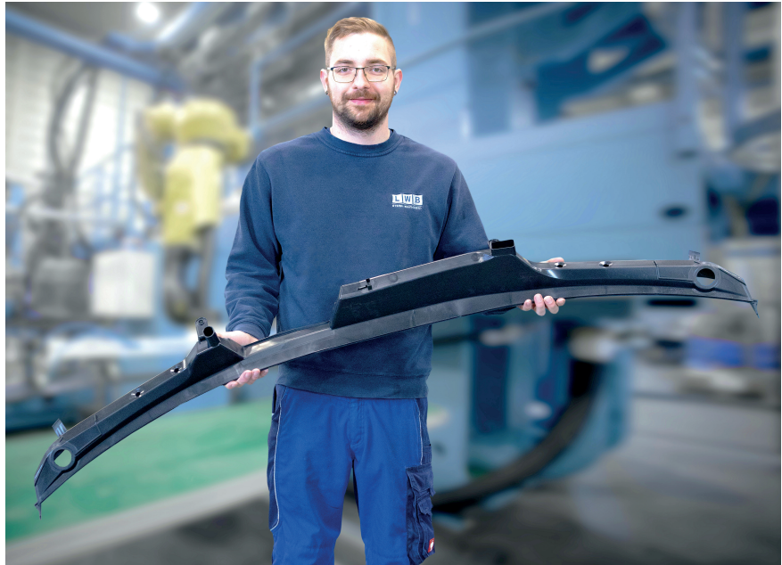
Bild 1. Ein Beispiel für lange schmale 2K-Automobilkomponenten ist die „Wasserkastenblende“, die den Bereich vor der Windschutzscheibe über die gesamte Fahrzeugbreite abdeckt

2K-Automobilkomponenten sind in der Eldisy-Spritzgießabteilung nichts Neues. Beispiele aus der bisherigen Auftragsfertigung sind Wasserabweiser, Schwellerleisten, Fugendichtungen oder Fensterführungen. Die dafür eingesetzten Produktionsmaschinen waren bzw. sind die 2K-Varianten konventioneller Horizontal-Spritzgießmaschinen verschiedener Hersteller, alle ausgerüstet mit einem Drehtisch auf der beweglichen Maschinenplatte und der Einspritzung mit zwei