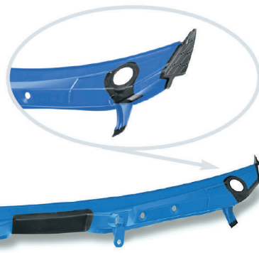
Bild 2. Das Formteil wird aus zwei Thermoplast-Komponenten gefertigt: Der Hauptkörper aus Polypropylen ist an den Anlagestellen zur Karosserie und in den Durchgangsbereichen für die Scheibenwischer mit elastischen TPE-Partien kombiniert